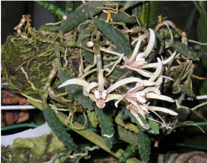
Dendrobium cucumerinum

Mijn moeder had een bloemenzaak aan huis. Misschien dat daar mijn interesse voor planten ooit begon. En met haar kwam ik, toen ik een jaar of 13 was, bij Exotic Orchids in Venlo. Niet voor de orchideeën, maar voor kleine Tillandsia's die, dat was de mode in die tijd, met een lijmpistool op druiventakken geplakt werden om als 'luchtplanten' verkocht te worden. Mijn moeder zocht de Tillandsia's uit en ik keek rond en raakte gefascineerd door de orchideeën die aan blokjes en takjes hingen te bloeien. De wortels gewoon in de lucht. Na een praatje met de eigenaar daar, en ik denk een praatje met mijn moeder, ging ik met mijn eerste drie orchideeën naar huis. Een Oncidium splendidum , een Coelogyne cristata en een miezerig klein stukje Dendrobium cucumerinum . Niet echt planten die ik nu een beginner zou aanraden! Ze hadden echter gemeen dat ze mooie bloemen hadden en ook een bijzonder uiterlijk.