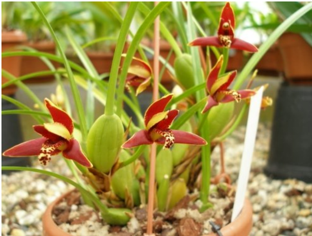
Maxillaria houteana in de hortus Leiden