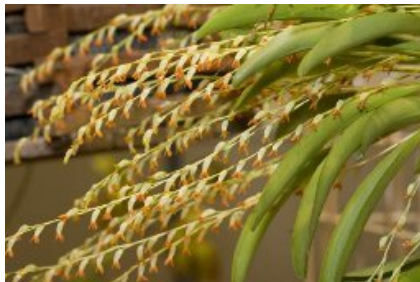
Physosiphon tubatus