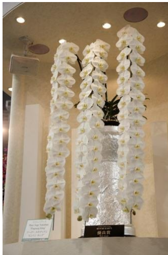
Reuzenphalaenopsis wint 3e prijs Kyoto orchidshow 2008