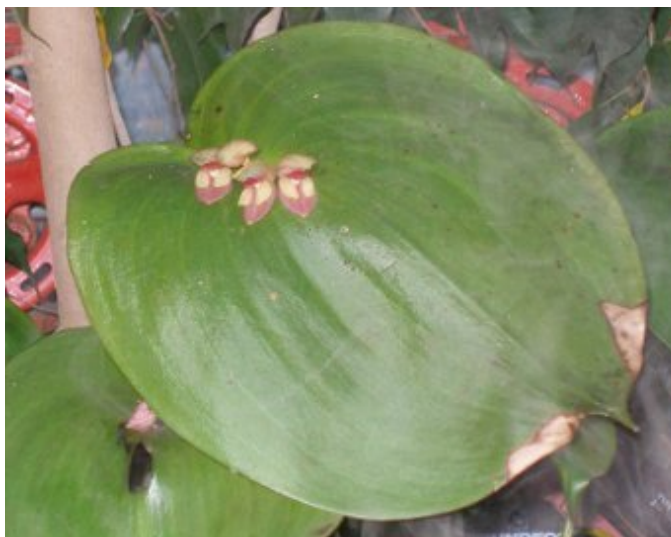
Pleurothallis spec.

Een groot geslacht van veelal kleine plantjes. Sommige zijn heel specialistisch, maar er zijn ook een aantal aantrekkelijke soorten die prima te houden zijn. Ton Sijm zal ons deze avond vertellen over orchideeën uit het geslacht Pleurothallis en de directe familie daarvan.