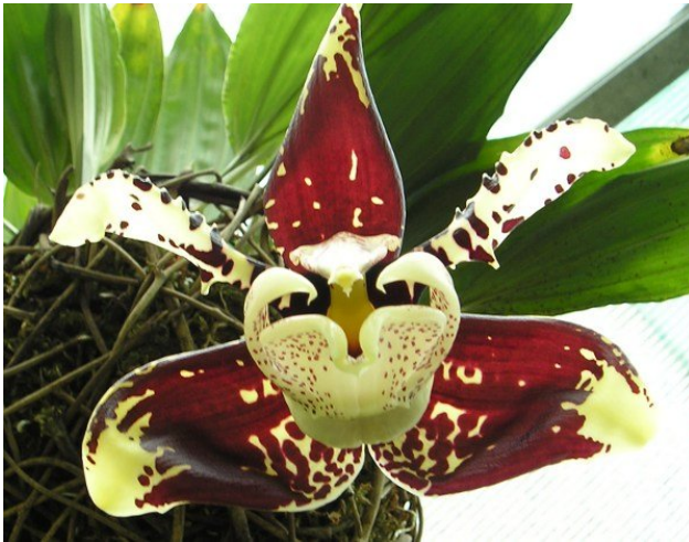
Stanhopea tigrina