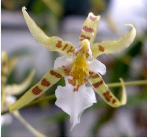
Oncidium phymatochilum

Een paar maanden geleden vertelde een van onze kringleden - ik zal maar geen namen noemen - dat hij de bloemstengels uit zijn Oncidium phymatochilum had geknipt omdat hij er na een paar maanden op uitgekeken was. Ik was enigszins gechoqueerd, vooral omdat het mij zoveel moeite kost om dat ding in bloei te krijgen. Maar het bracht me wel op het idee om eens te schrijven over 'saaie' orchideeën.