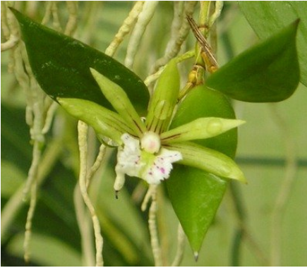
Dockrillia pugioniforme

Dockrillia pugioniforme is ook al zo'n stomvervelend geval. Als je hem goed weet te kweken, dan bloeit hij rijk en op alle blaadjes tegelijk en is dit na enkele weken weer voorbij. Dan kun je je weer een jaar verheugen op de volgende bloeiperiode. Maar helaas is het meestal een komen en gaan van enkele bloemetje verspreid over de