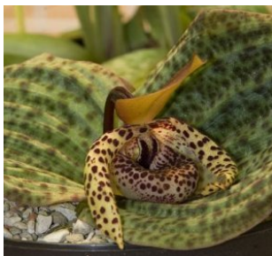
Cypripedium daliense