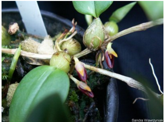
Bulbophyllum comberi

Bulbophyllum comberi : Bloemgrootte 2mm. Schaduw, heet, bloeitijd in voorjaar. Gevonden op het Maleisisch schiereiland, Java en Borneo in laaggelegen bergwouden op een hoogte van 750 tot 840 meter. Het is een miniatuurorchidee die groeit op zeer warme plekken op stammen van bomen en een enkele keer op de grond. Hij heeft bolvormige, geribde, hoekige bulben van ruim 1 cm groot. Ze zitten in een basaal schutblad en hebben twee aan de basis dubbelgevouwen bladeren die op de top van de bulb zitten (op de foto zie ik maar een blad?). Hij bloeit in het voorjaar op een zeer kort bloemstengeltje vanuit de basis van de bulb met slechts een bloem die meestal onder het blad blijft. (NH)