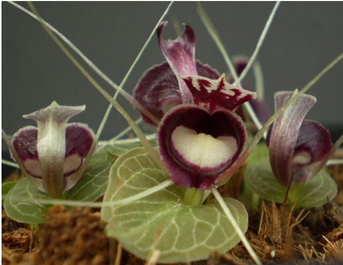
Corybas pictus

Zoals gebruikelijk is de eerste kringavond van het jaar gereserveerd voor de jaarvergadering. Bovendien wordt vanavond de uitslag van de competitie 2009 bekendgemaakt met de uitreiking van de bekens.