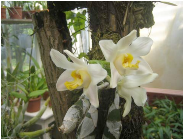
Chysis aurea

Onze kringavond staat geheel in het teken van het 45 jarig jubileum van onze Kring dit jaar. We maken we er een bijzondere avond van waarbij we kunnen genieten van vele planten in showopstelling in de fraaie kas van Josina.