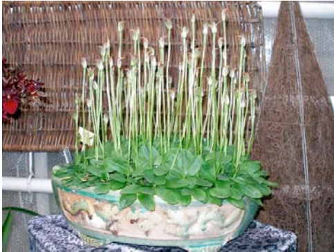
Pterostylis curta x pedunculata

Dit geslacht is in te delen in drie groepen: