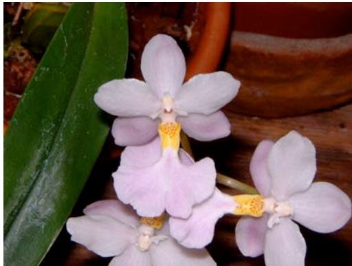
Cuitlauzina pendula

Het gebied, met een ongelooflijke soortenrijkdom, heeft afgelopen maand de status van Réserve Naturelle Régionale gekregen. Hij zal ons vertellen over het werk van de stichting, over de rijke flora en fauna en natuurlijk vooral over de prachtige orchideeën die er groeien.