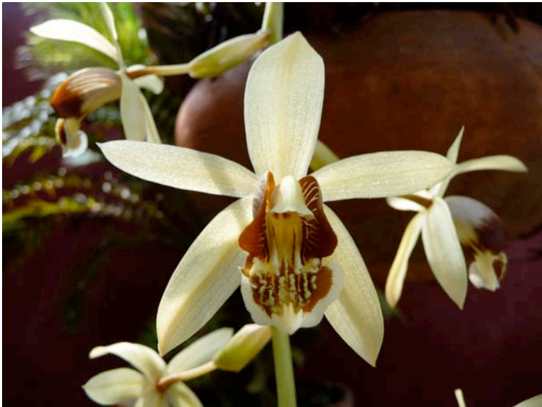
Coelogyne dayana