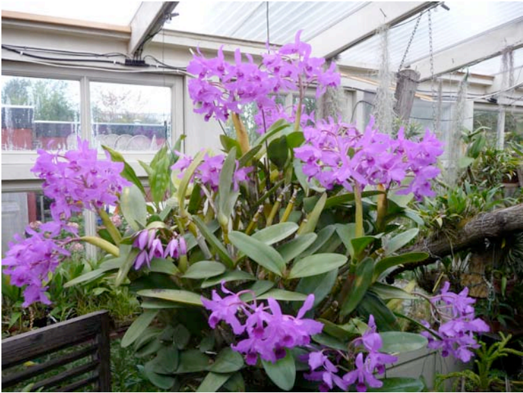
Cattleya bowringiana