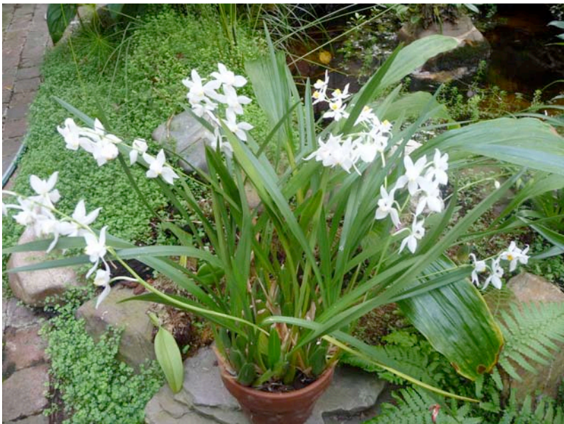
Osmoglossum pulchellum