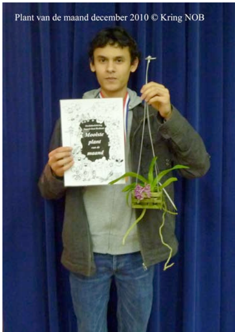
Plant van de maand december 2010