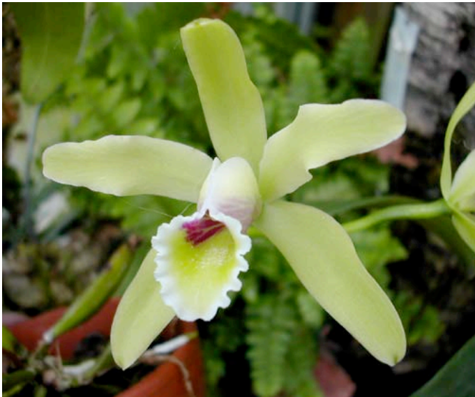
Cattleya luteola