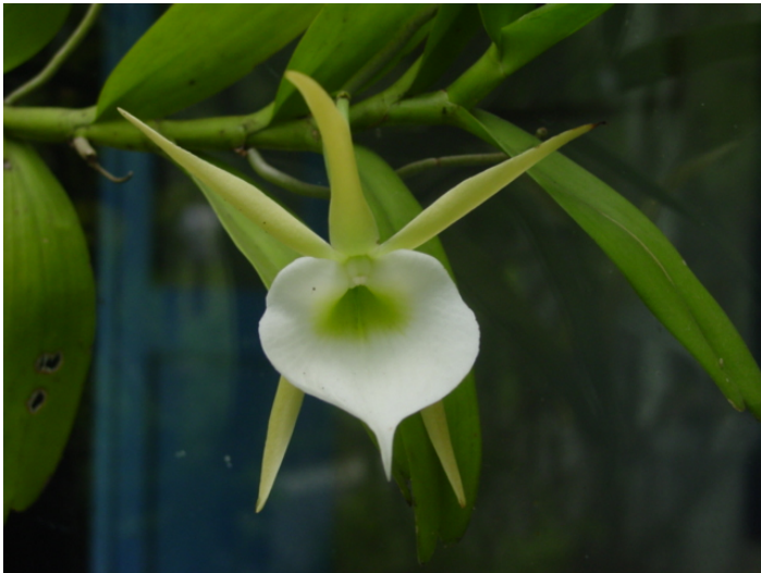
Angraecum infundibulare