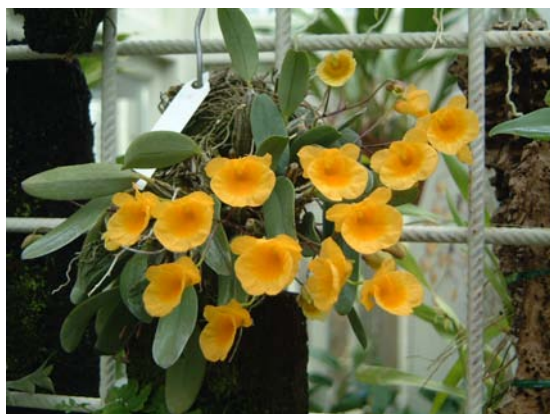
Dendrobium jenkinsii