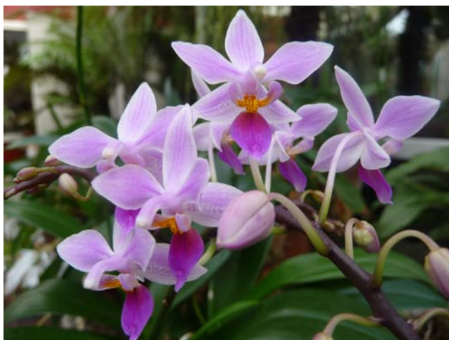
Phalaenopsis aequestrans