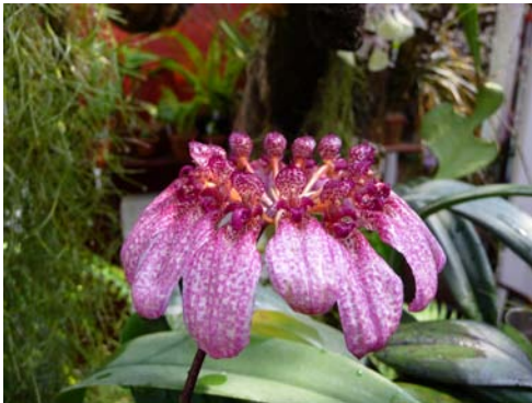
Bulbophyllum eberhardtii

B. reinwardtii en B. grandiflorum behooren tot de matige groeiers en worden gekweekt of in lage pannen of in lage teakhouten mandjes. Wat of men gebruikt, de pannen of de mandjes, men denke er steeds om deze voorwerpen voor de helft te vullen met schoon gewasschen potscherven, waarover een laag ruwe Sphagnum gelegd wordt, dat men bedekt met een laag compost. Voorzichtig worden hierop de planten uitgespreid en met compost aangevuld. De compost wordt klaar gemaakt van varenwortelgrond en Sphagnum, van ieder de helft, plus kleine stukjes potscherven en zand die men er doorheen werkt. Nog moeten wij mededeelen, dat het Sphagnum en peat zeer fijn gemaakt moet worden, terwijl het aanbeveling verdient de planten stevig aan te drukken.