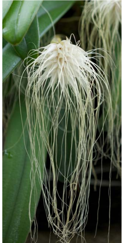
Cirrhopetalum medusae

Wat betreft de cultuur willen wij er op wijzen dat de soorten B. ericssonii en B. virescens een kruipende wortelstok bezitten en zij het beste groeien op