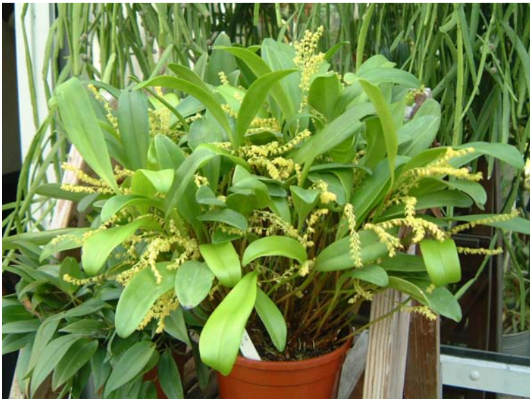
Pleurothallis sp

Het is weer zover, onze jaarlijkse najaarsveiling staat weer voor de deur. Een uitgelezen kans om je verzameling voor een aantrekkelijke prijs uit te breiden of je overvloedige planten te verkopen.