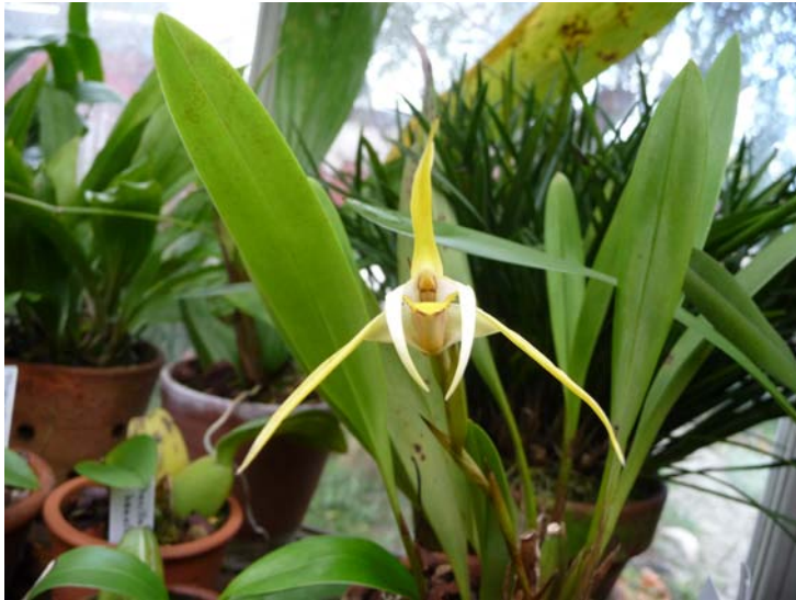
Maxillaria ochroleuca