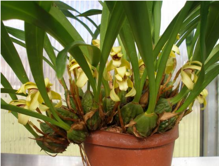
Maxillaria porphyrostele, die aan verpotten toe is

Er wordt wat inzicht gegeven over de wijze waarop de orchideeën gekeurd worden. De belangrijkste activiteit echter is het verpotten van planten. Neem voor deze avond dus gerust planten mee die verpot moeten/mogen worden. We gaan er samen mee aan de slag. Voor materialen wordt gezorgd.