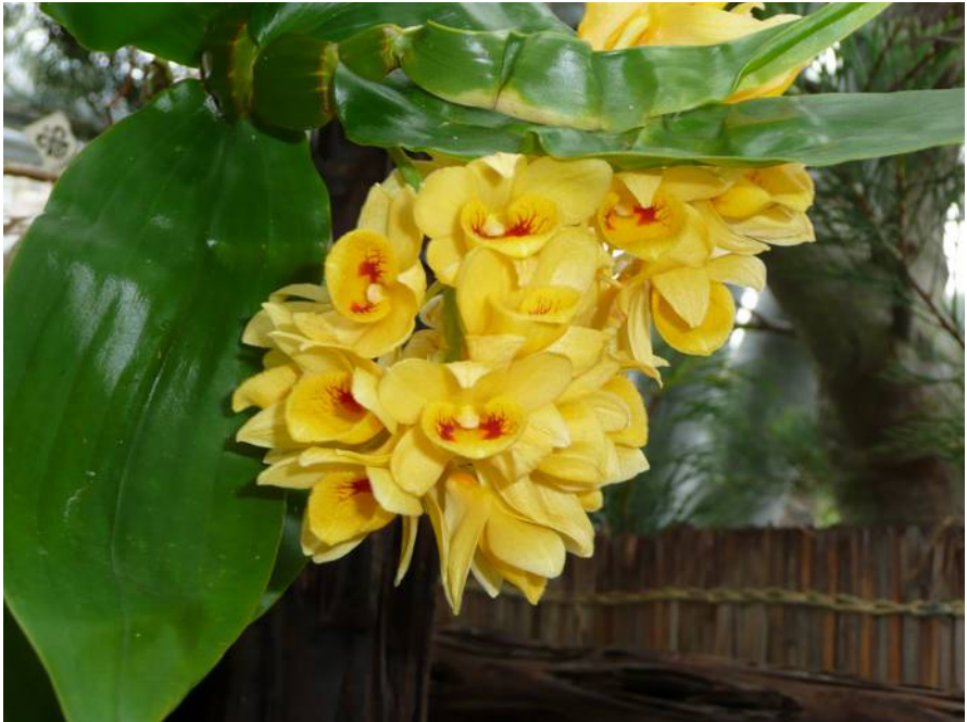
Dendrobium sulcatum

Let op: De aanvang van deze avond is vroeg. Aankomst 17.30 u en diner om 18.15u. Daarna hebben we een kringavond met keuring van de planten, het kiezen van de beste 3 planten, een doorlopende fotoshow en de prijsuitreiking van de fotowedstrijd en natuurlijk is er gelegenheid om de show alvast uitgebreid te bekijken.