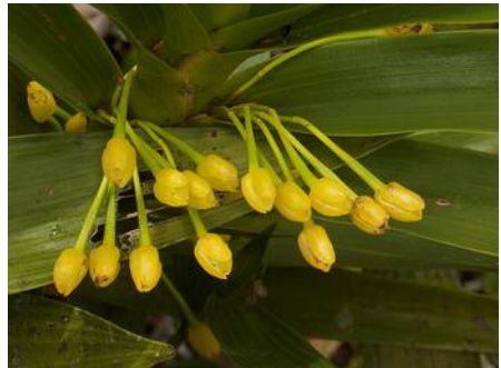
Maxillaria aurea