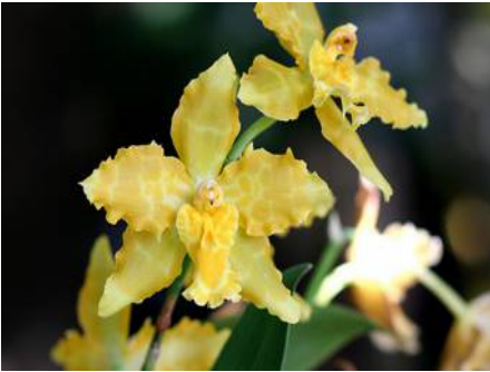
Oncostele Geyser Gold