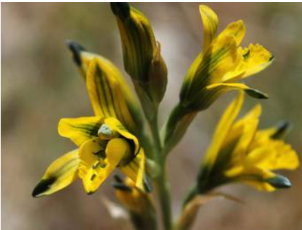
Chlorea aurantiaca