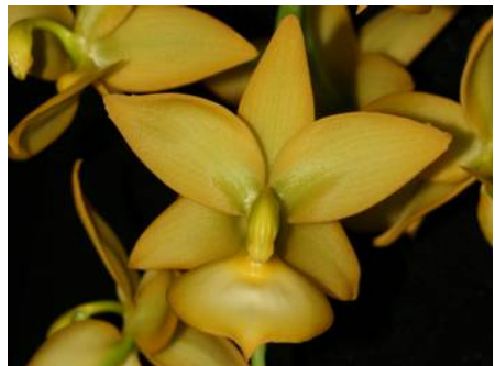
Cycnoches Taiwan Gold