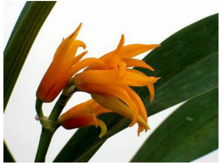
Ada aurantiaca