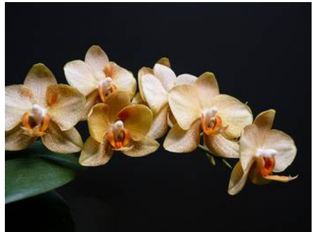
Phal. Mystik "Golden Leopard"