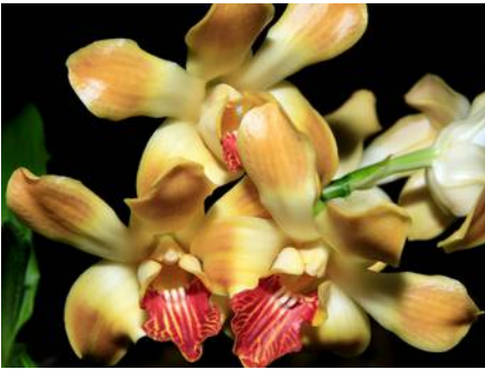
Chysis aurea