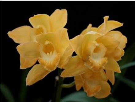
Cymbidium Pharaos Gold