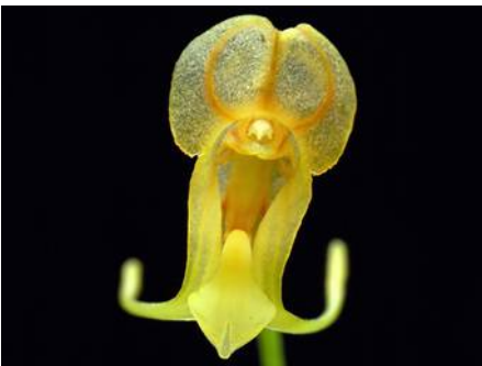
Porroglossum aureum