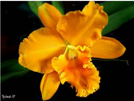
Potinara Hwa Yuan "Gold"