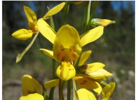
Diuris aurea