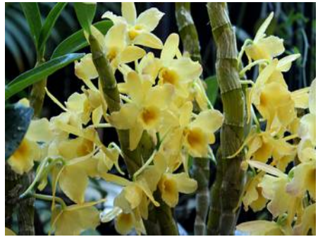
Dendrobium Golden Blossom