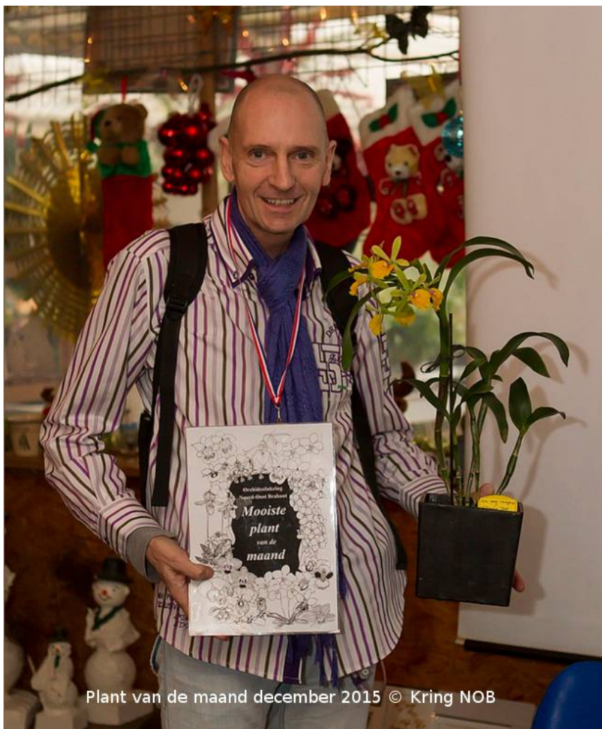
Plant van de maand december 2015

Dat hybrides niet lelijk hoeven te zijn kunnen we vaak zien op de kringavond. De plant van de maand december is daarvan een mooi voorbeeld: een behoorlijk complexe hybride met een heerlijk eenvoudige bloem. En natuurlijk is deze Epicattleya 'René Marqués' x Potinara 'Free Spirit' goed gekweekt door Jos Nuyten. Proficiat!