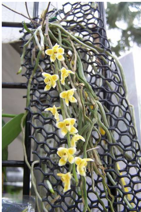
Chiloschista lunifera

bladgroenkorrels in deze laag, waardoor de wortels mee doen aan de fotosynthese (het omzetten van water en koolzuur in suiker en zuurstof). Bij sommige orchideeën, zoals Chiloschista 's, doen ze dat zo goed, dat ze het grootste deel van het jaar zonder blad doorkomen!