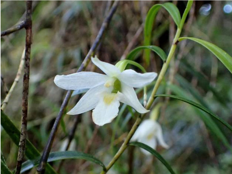
Dendrobium cunninghamii

Het is dan ook een genot om naar zijn met Vlaamse humor doorspekte reisverhalen te luisteren. Deze keer gaat de reis naar letterlijk de andere kant van de wereld: Nieuw-Zeeland. Niet het eerste land waar je aan denkt bij orchideeën, maar Patrick zal ons laten zien en horen wat daar allemaal te vinden valt.