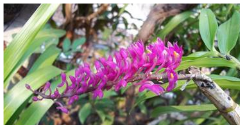
D. secundum

Zo'n klein stukje geeft ons toch behoorlijk wat informatie over deze plant. Ze groeit blijkbaar goed in Bandung dat op zo'n 750m hoogte in West-Java ligt. Niet extreem warm dus, eerder gematigd, maar zeker ook niet koud. De plant staat er op bomen op een kerkhof. Dat zal een redelijk open plek zijn waar veel lucht en licht komt. Dat ze veel licht nodig hebben wordt nog duidelijker als de schrijver vermeldt dat de bomen in de moessonijd kaal staan. Dat is juist de tijd dat ze bloeien.