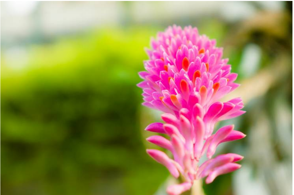
Dendrobium secundum

maar vaak zelfs twee of drie jaar oud. Ze kan vaker op dezelfde stengel bloeien. De vele kleine bloemetjes staan in een trosje allemaal naast elkaar naar één kant gericht. Vandaar het tweede deel van de naam: 'secundum' betekent 'langs of naast'. Dat maakt ook dat de bloeiwijze aan een tandenborstel doet denken. De kleur is meestal roze of paars al zijn er enkele extreme kleurvariëteiten zoals (bijna)rood of wit. De lip is altijd geel of oranje van kleur en steekt mooi af bij de rest van het bloemetje.