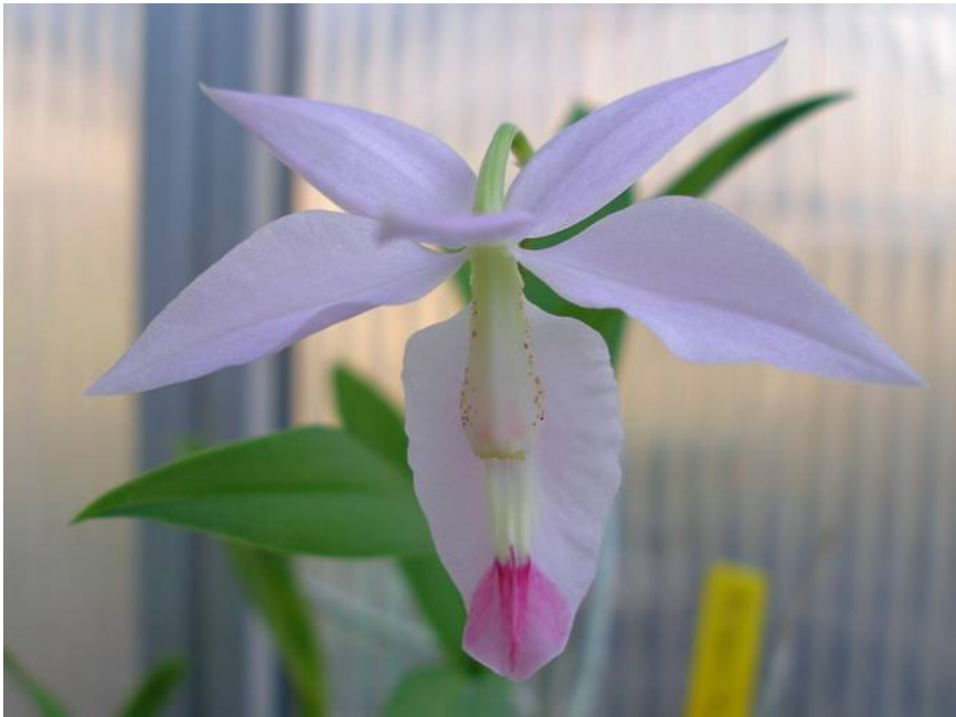
Barkeria spectabilis semi-alba