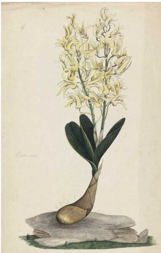
Rock Lily - Dendrobium speciosum