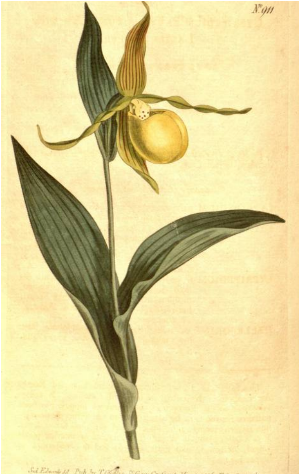
Cyripedium parviflorum var. pubescens