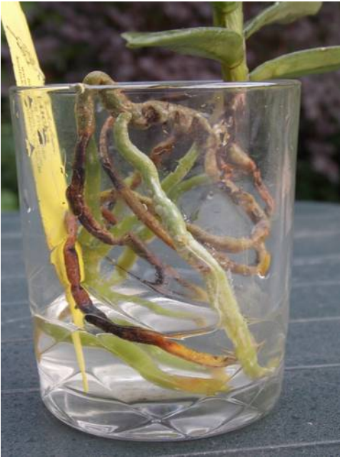
Renanthera monachica in FWC. Oude wortels bruin, nieuwe "waterwortels" groen

zwaar door blackrot was aangetast. Ik heb de wortels van de planten goed schoongemaakt en vrijwel alle oude slechte wortels weggeknipt voordat ze in het bodempje water gingen. De planten staan op de vensterbank, want het is wel belangrijk dat het water niet te koud wordt (20 graden is goed). Het water vul ik eens per week aan, soms vaker, soms minder vaak. Tot mijn verbazing begonnen alle planten na enkele weken nieuwe wortels te maken. Wel rotten de wortels die er al aanzaten helemaal weg in het water. Bij die rottende wortels heb ik het water een paar keer verversst om besmetting van de nieuwe wortels te voorkomen. De nieuwe wortels groeien het water in en blijven tot nu toe gezond.