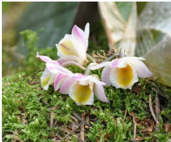
Dend. lamellatum var purpuratum

Al met al, een plant die niet in mijn kweekcultuur past. Dat hoeft ook niet. Ik zal elke keer met veel plezier genieten van de plant als Thijs hem weer meeneemt.