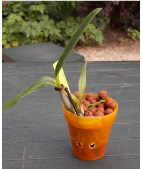
Encyclia ging zonder wortels in SHC. Heeft nu nieuwe wortels en een scheutje.

krijgen. En dat lukt me hierin beter dan in een klassiek mengsel.