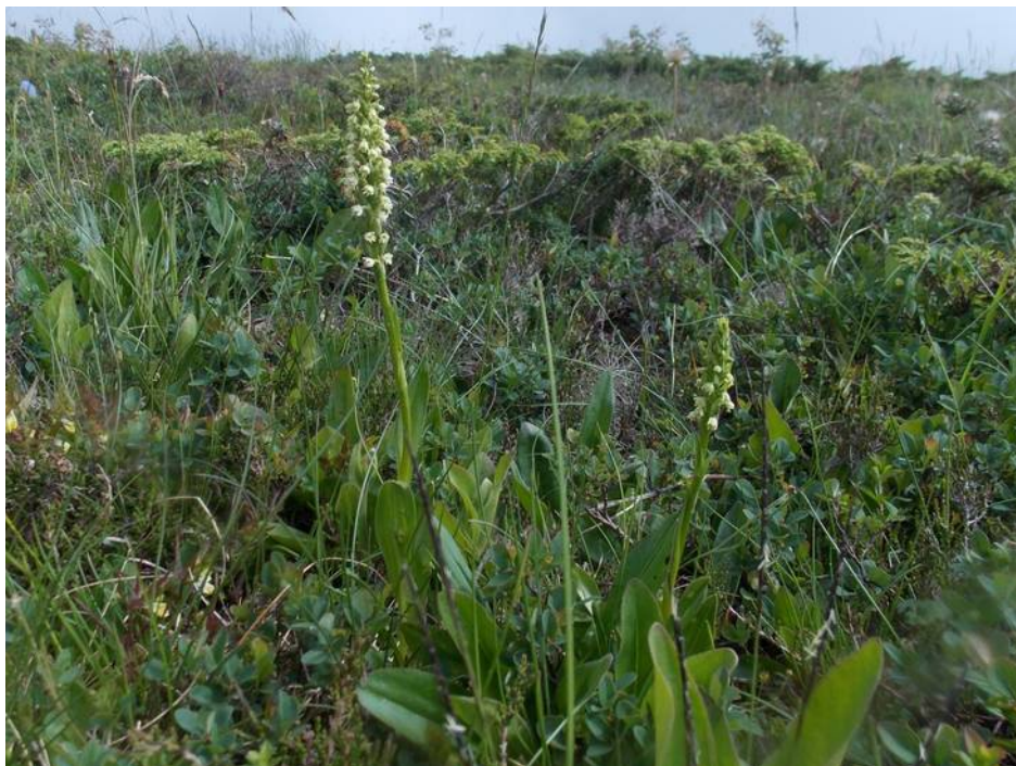
Pseudorchis albida , Valle de Cestrède, Pyreneëën