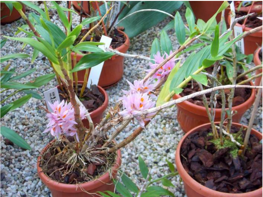
Dendrobium bracteosum in Hortus Leiden