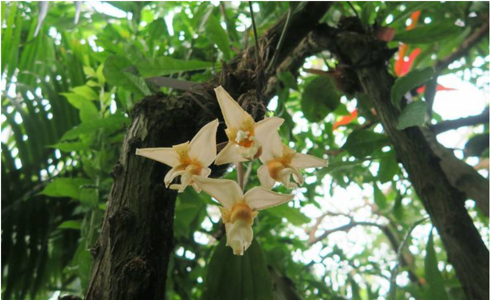
Stanhopea sp.

Het antwoord op de vraag is natuurlijk dat de plant in de natuur niet in een mandje, noch op de grond groeit. Hij groeit in de natuur op takken van bomen en de bloemen hangen dan vrij in de lucht. Soms groeit de plant boven op een horizontale tak en dan komen de bloemen aan de onderkant zoals wij dat hier met onze mandjes ook graag zien. Veel vaker echter groeit de plant op een min of meer verticale tak en hangen de bloemen aan de onderkant langs de stam. Met evenveel plezier hangt de hele plant aan de onderkant van de tak. De balderen buigen dan links en rechts van de tak omhoog en de bloemen hangen van tussen de bulben uit naar beneden. Hoe de plant ook groeit, de bloemen willen hangen. Probeer ze dus ook niet met stokjes te sturen of overeind te houden!