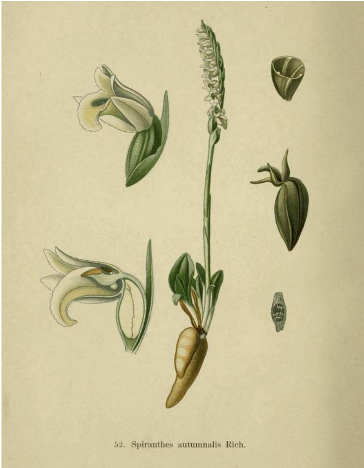
52. Spiranthes autumnalis Rich.

Herfstschroeforchis - Spiranthes spiralis