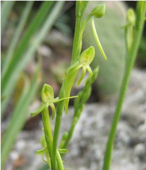
Habenaria trydactylis

Tropische aardorchideeën zijn een beetje een ondergeschoven kindje bij veel liefhebbers. Onterecht, zo bleek vorige maand wel weer toen een gele Habenaria rhodocheila plant van de maand werd. Aardorchideeën hebben de naam wat lastig te zijn. Misschien ook wel omdat de planten zich een deel van het jaar onder de grond terugtrekken. Daar staat tegenover dat ook sommige andere orchideeën een rustperiode nodig hebben.