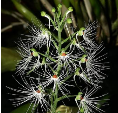
Habenaria medusa

ook door vlinders bevrucht. De soort komt voor in heel zuid-oost Azië en groeit daar in humus in scheuren en kleine holtes van rotsen. Vaak staan ze in de buurt van stromend water. In het groeiseizoen behoorlijk nat, maar ook met enkele maanden volstrekte droogte. Als je dat na kunt doen zijn het geen moeilijke planten.