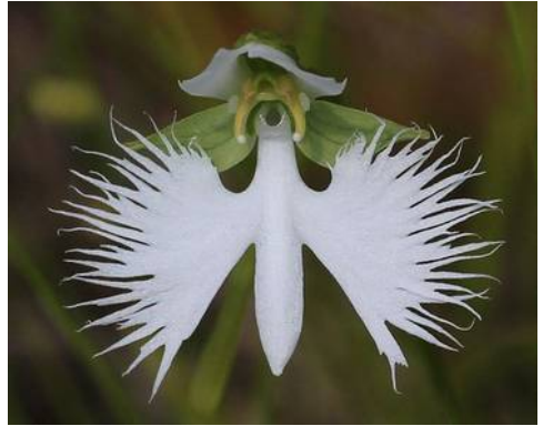
Pecteilis radiata (syn. Habenaria radiata )

wonderlijke schoonheid. Wit met een rood accentje en een krans van stralende franjes aan de lip. Elke bloem kan wel 4 tot 5 cm groot zijn.