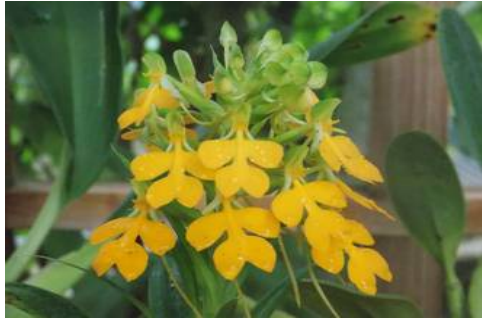
Habenaria rhodocheila (syn. xanthocheila )

Ook Europa heeft er een, als je de Canarische eilanden tenminste bij Europa rekent: Habenaria trydactylites . Deze Europeaan is, zoals veel soortgenoten niet erg opvallend, maar er zitten ook een paar zeer opvallende planten in het geslacht die we gelukkig af en toe tegenkomen.