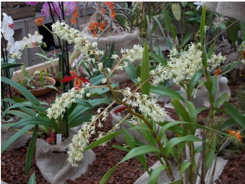
Epidendrum purum gezien op de show van kring Brabant ZO 2017