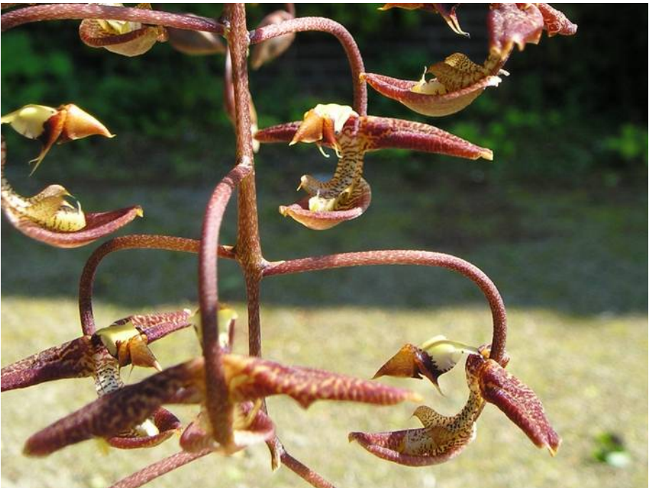
Gongora grossa x galeata

Op deze kringavond gaat onze eigen Sjors zijn verhaal vertellen over Gongora's. De familie Teurlincx heeft in de loop van de tijd een aardige collectie Gongora's verzameld en Sjors is inmiddels goed bekend met dit geslacht. Het belooft dan ook een goed verhaal met mooie beelden te worden.