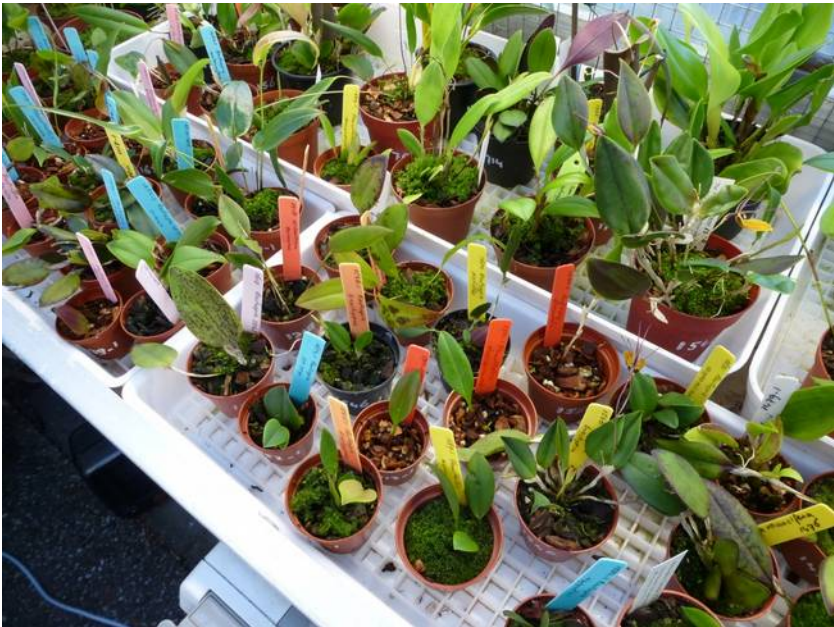
Restrepias in speciale bakken bij Harald Mexsenaar

Koop en/of verkoop planten en verbeter zo je collectie!