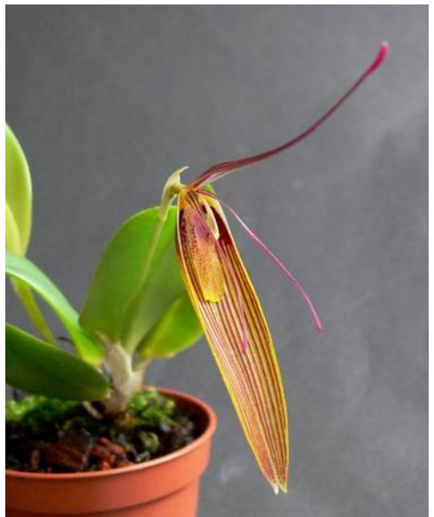
R. antenniferum gigantea

staan deze bakken vrijwel droog terwijl de luchtvochtigheid toch rond 80% blijft. Voordeel dat de planten in deze bakken staan is tevens dat een potje niet zo gauw om valt of als je deze aanstoot van de plank af valt maar in de bak blijft staan. Zorg voor een getemperde verlichting gedurende ongeveer 12 uur.