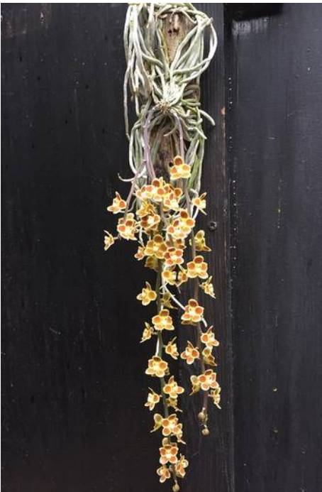
Chiloschista lunifera