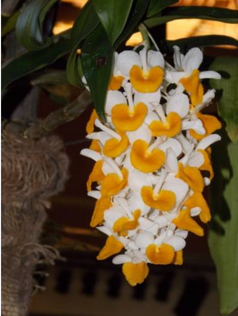
Afbeelding 1: Dendrobium thrysiflorum

bloemen dragen. Deze soorten kunnen met wat minder licht toe en D. farmeri heeft zelfs graag lichte schaduw. Ze hebben graag een wat langere rustperiode waarin ze weinig water krijgen, maar wel een hoge luchtvochtigheid hebben.