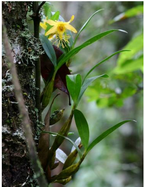
D. brymerianum