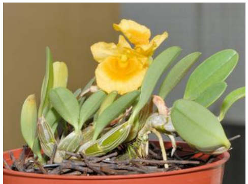
D. jenkinsii

De soorten uit de Densifloragroep komen uit de berggebieden van centraal Azië: van de Himalaya in het westen tot Yunnan in het oosten en dan zuidelijk tot in Maleisië. Ze kennen allemaal een duidelijke rustperiode die relatief droog is en een korte sterke groeiperiode waarin overvloedig water gegeven moet worden. De meeste soorten hebben een vrij grote lichtbehoefte, met name tijdens de rust. Van nature groeien ze in bladverliezende bossen.