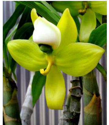
Cycnoches lehmannii

Wat betreft cultuur zijn het redelijk eenvoudige Catasetinae . Warm en vochtig met veel licht in het groeiseizoen en een strenge rustperiode in de winter. In principe bloei aan het begin van de rustperiode en als je geluk hebt ook af en toe in de zomer van tussen de bladeren uit. Een aardigheidje dat van de Cycnoches over is gebleven.