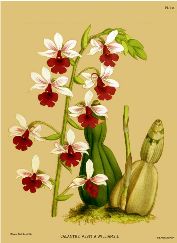
CALANTHE VESTITA WILLIAMSII.