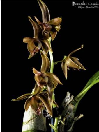
Mormodes sinuata

De plant van de maand, Cycnodes Wine Delight , is een kruising van Cycnoches lehmannii en Mormodes sinuata . Dat is dus een primaire intergenerische hybride. Primair omdat het een hybride is van twee natuursoorten en intergenerisch omdat die twee soorten uit twee verschillende geslachten komen. De naam Cycnodes is een combinatie van Cycnoches en Mormodes . De hybride is geregistreerd in 1980 en het is dus een relatief jonge hybride. Hoewel hij in de groep van Catasetinae een van de oudere is.