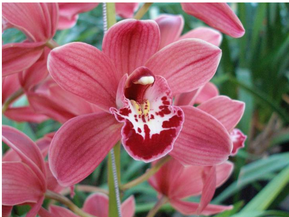
Cymbidium Red Baker Benjamin

Traditiegetrouw beginnen we het nieuwe jaar met de algemene ledenvergadering. In dit boekje vindt u de daarvoor benodigde stukken. Tijdens de ALV zullen ook de prijzen van de competitie uitgereikt worden. Om de spanning erin te houden staat de uitslag van de keuring van december nog niet in dit boekje. De tweede helft van de avond bekijken we een videofilm.