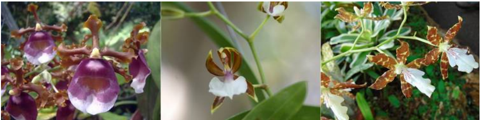
De grootouders en ouders: Oncidium fuscatum , cariniferum en maculatum