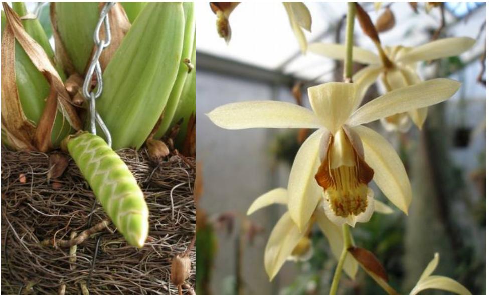
Coelogyne tomentosa (syn. massangeana )

Van beide soorten zijn de bloemen variabel van kleur, maar altijd in het spectrum beige-geel-groen met bruine en witte accenten. Helaas blijven zij het geen blijvertjes. Na een week of twee is het schouwspel voorbij en moet je weer een jaartje wachten, hoewel Coelogyne tomentosa er soms nog eens een extra bloemstengeltje tussendoor doet.