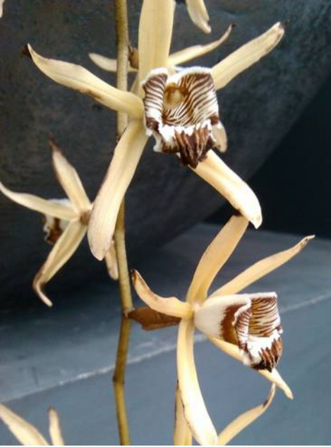
Coelogyne parviflora (syn. dayana )