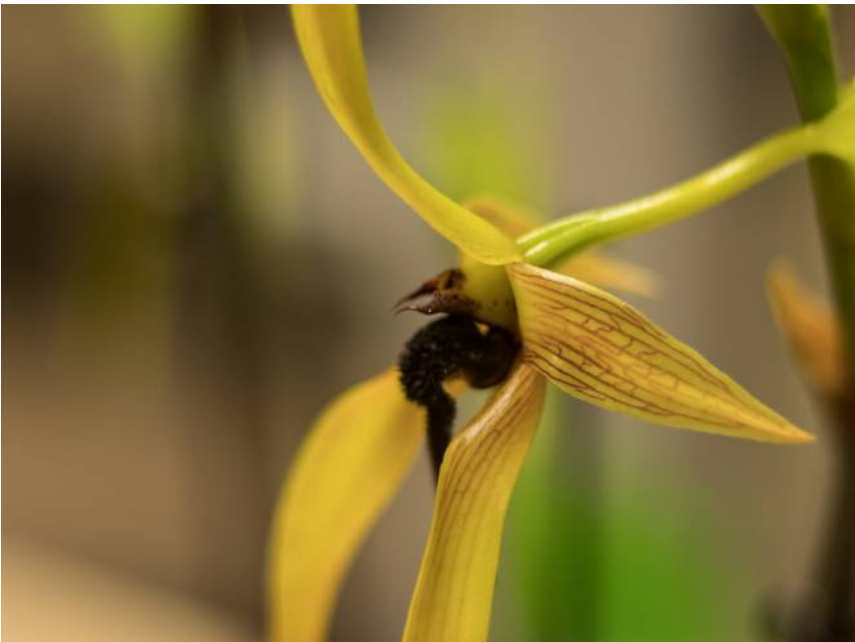
Detail van Bulbophyllum Wilbur Chang.

De kruising leek op de kringavond geen geur te hebben. Misschien dat het slechts het moment van de dag was, maar als het een gevolg van de kruising is, dan is het alleen daarom al de moeite waard om de kruising te maken!