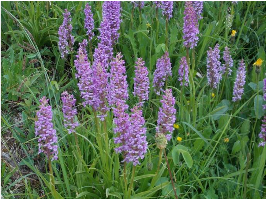
Gymnadenia conopsea - muggenorchis