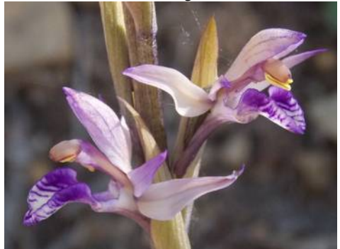
Aspergeorchis - Limodorum abortivum