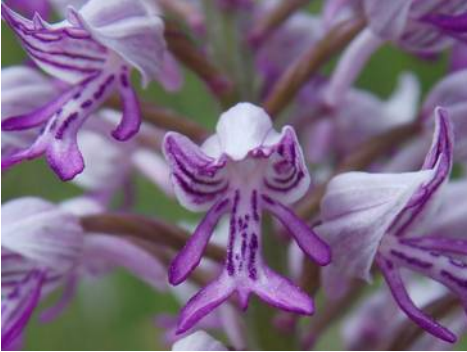
Soldaatje - Orchis militaris

De vakantiemaand is weer voorbij. Gelukkig hebben we de foto's nog! Alpes des Haute Provence, juni 2019