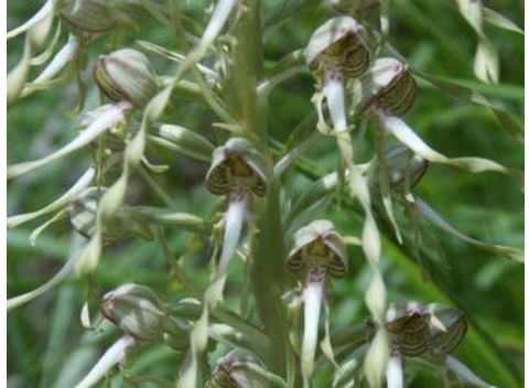
Bokkenorchis - Himantoglossum hircinum