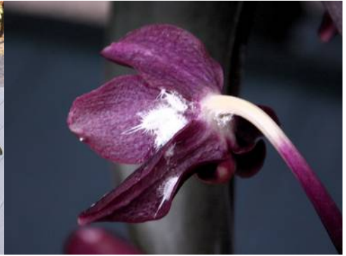
... toch maar liever niet!