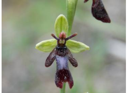
Vliegenorchis - Ophrys insectifera