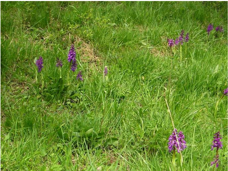
Veldje met Orchis mascula in de Eifel

Voor orchideeën in het wild hoef je niet altijd ver weg te gaan. Er zijn plekken in Nederland waar van alles te vinden valt en vlak over de grens vaak nog meer. Jos Janssen vertelt ons deze avond over orchideeën in de Eifel. Een mooie streek waar je in een paar uur naar toe rijdt. Kom daarom deze kringavond inspiratie opdoen voor een mooi dagje uit.