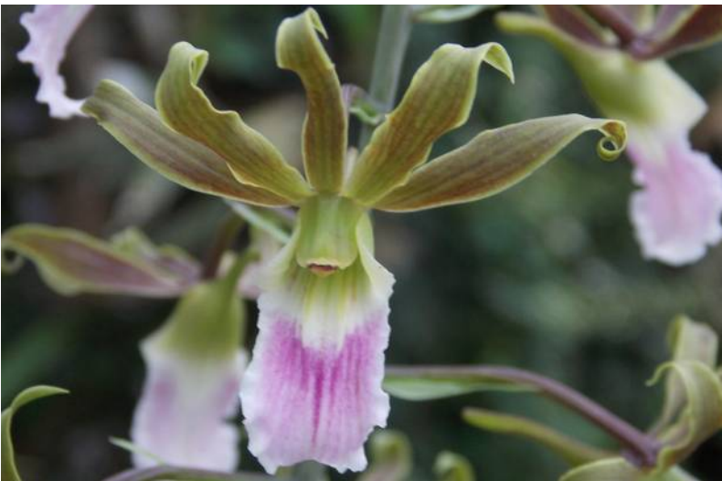
Eulophia Shamara (euglossa x guineensis)