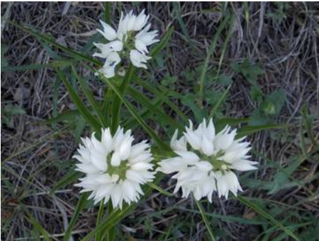
Wit Bosvogeltje - Cephalanthera longifolia