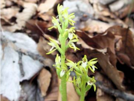
Koraalwortel - Corallorrhiza trifida