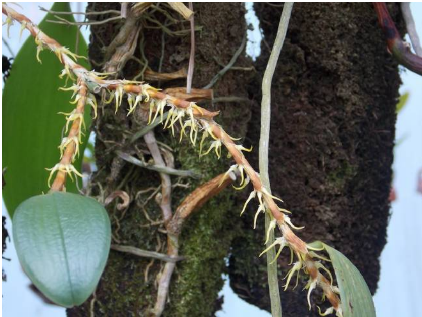
Bulbophyllum sp. (Papua Nieuw Guinea)

Openingstijden : Maandag t/m Vrijdag 9.00 uur – 18.00 uur Zaterdag 9.00 uur – 17.00 uur