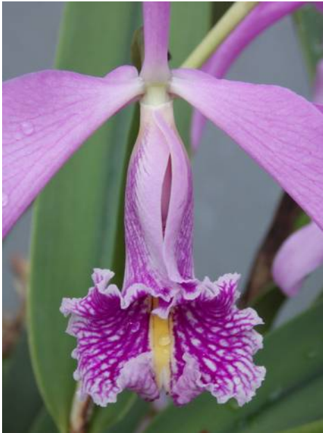
Cattleya maxima (lip)

In 1844 komen er voor het eerst planten van deze toen al befaamde soort naar Europa in een zending van de plantenjager Karl Hartweg die in die tijd honderden nieuwe soorten uit Midden-Amerika haalde. Ook andere plantenjagers zoals Jozef Warscewicz stuurden in die jaren planten van deze soort naar Europa. Er bleek een grote variëteit in planten en bloemen te bestaan. Er waren exemplaren met lange planten - bulben van 30 cm en meer - en korte planten - bulben een 15 cm. De kleinere planten maakten grotere bloemen. Sommige planten maakten nooit meer dan 2 of 3 bloemen op een scheut, anderen wel