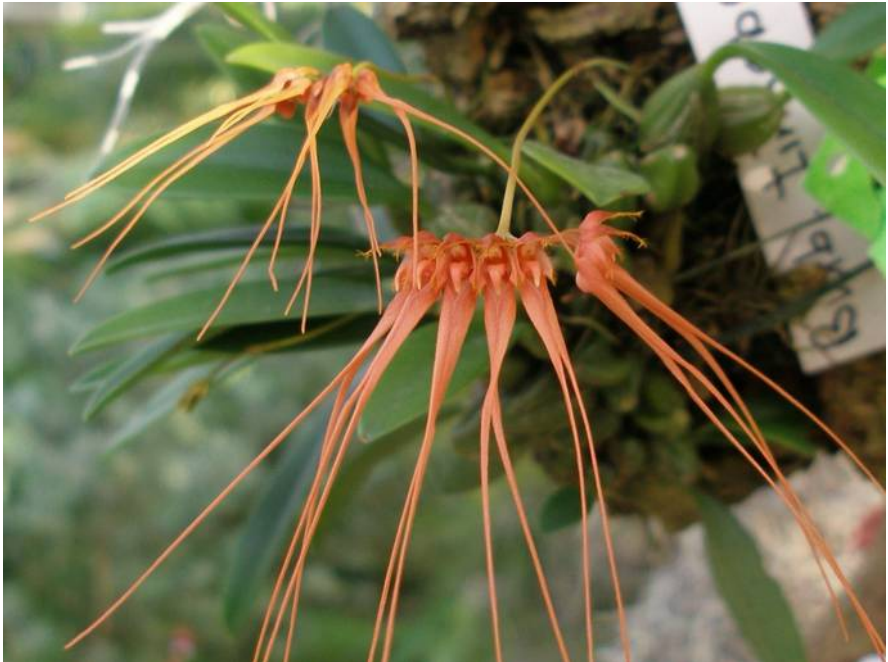
Bulbophyllum pecten-veneris (syn. tingabarinum )