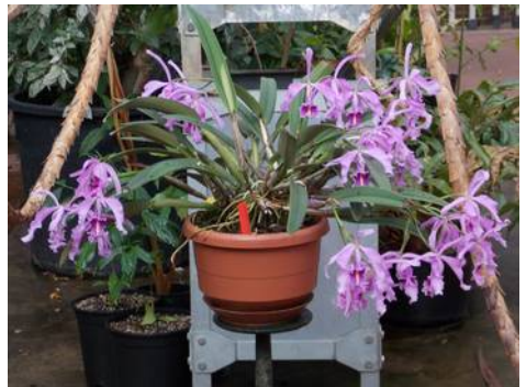
Cattleya maxima (plant Hortus Bot. Leiden)

De Spanjaarden noemden deze soort "Flor de Navidad", wat Kerstbloem betekent. Ze bloeien in de natuur meestal in december. In de 19e eeuw dacht men dat Cattleya maxima zeer warm gekweekt moest worden. Voor sommige variëteiten is dat zo (onder andere die met lange bulben). Maar de meesten gaan prima gematigd. Geef ze wel veel licht, een luchtig mengsel en vooral in de groei veel water. In de winter willen ze graag een beetje droger staan. O ja, en je bent gewaarschuwd, het kan zomaar de plant van de maand worden!