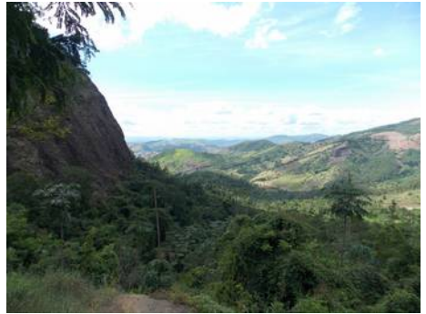
Mata Atlantica in de staat Minas Gerais

Hoe anders is dat bij Miltonia ! Miltonia 's komen voornamelijk uit Zuid-Amerika. Veel soorten groeien in het Mata Atlantica ofwel de Atlantische bossen. Die bossen komen voor in een groot deel van Brazilië, vooral ten zuiden van het Amazonegebied. De bossen liggen in middelgebergte en krijgen hun regen vanaf de Atlantische Oceaan. Door de wisselende winden kan de temperatuur er behoorlijk variabel zijn. Soms wel tot 40 graden heet, maar soms met zuidelijke winden ook tot 10 graden koud. In de zomermaanden kan het er flink nat zijn, maar ook ineens weer een aantal dagen droog. In de wintermaanden is het er een stuk droger, maar kan het er toch soms dagenlang miezeren. Je voelt het misschien al aankomen. Deze planten zijn gemaakt om vergevingsgezind te zijn!