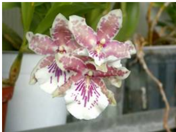
M. x leucoglossa

Stuk voor stuk probleemloze planten die wel graag veel licht hebben. En dan heb ik nog niet vermeld dat de meeste ook nog lekker geuren. Overigens kun je die laatste twee ook wel eens bij de bloemist tegen komen. Gewoon tussen de "Cambria's".