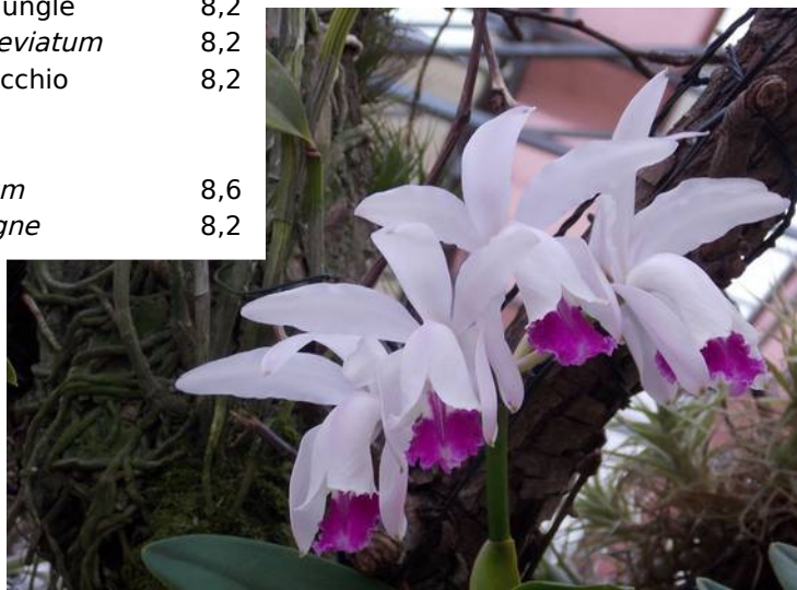
Cattleya x dolosa (= loddigesii x walkeriana )