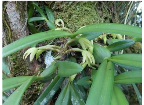
Maxillaria species (Panama)

En groen dan? Het blijkt dat onder andere vliegen en kevers juist die kleur heel goed waarnemen. Vliegen zien net als vogels vier kleuren, maar dat zijn vier kleuren die vrij dicht bij elkaar in het groen-gele spectrum zitten. Dat betekent dat die geel-groene kleuren voor vliegen een wereld op zich zijn die wij niet kunnen waarnemen. Coel. mayeriana wordt bestoven door kevers en wespen en die vinden het groen van deze bloem waarschijnlijk het mooiste dat ze kennen.