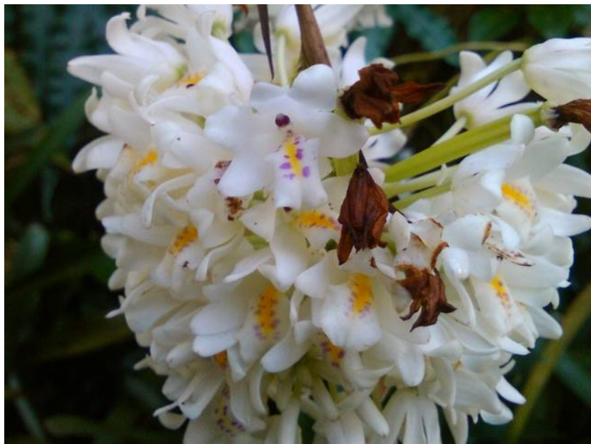
Polystachia neobenthamia (syn. Neobenthamia gracilis )

Openingstijden : Maandag t/m Vrijdag 9.00 uur – 18.00 uur Zaterdag 9.00 uur – 17.00 uur