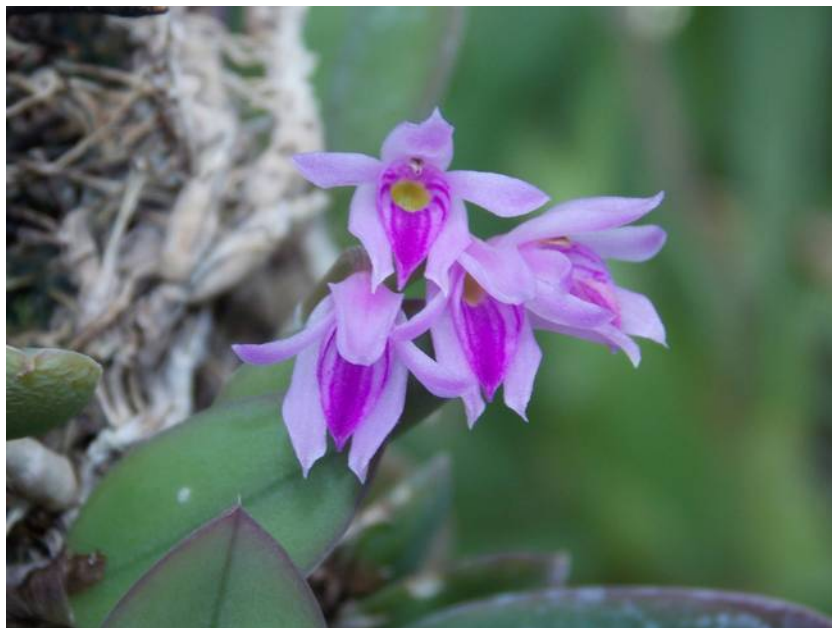
Meiracyllium trinasutum (syn. wendlandii )

Openingstijden : Maandag t/m Vrijdag 9.00 uur – 18.00 uur Zaterdag 9.00 uur – 17.00 uur