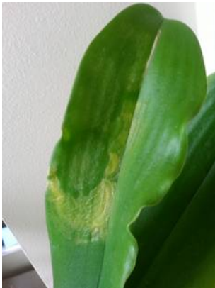
Mozaïekvirus in Phalaenopsis

Wel begint een virusinfectie vaak in de nieuwe scheut en gaat vandaar naar de wortels. Als je er snel bij bent is soms de plant te redden. Zorg dan wel dat de plant in isolatie gaat zodat ze geen andere planten kan infecteren! (net corona toch?)