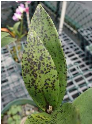
Ringvirus in Dendrobium

Nu de hele wereld in de ban van het Corona-virus is, kunnen we best eens aandacht besteden aan orchideeënvirussen. Ik bedoel nu niet dat virus waarmee velen van ons besmet zijn en dat ervoor zorgt dat er alsmaar meer planten in de kas en op de vensterbank komen. Het gaat om virussen die onze planten aanvallen.