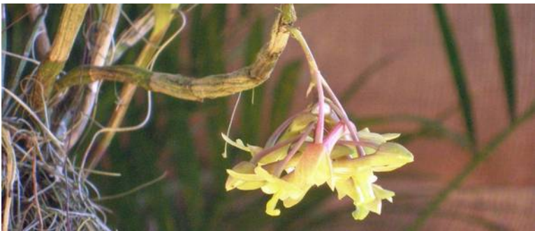
Dendrobium ionopus (syn. epidendropsis)