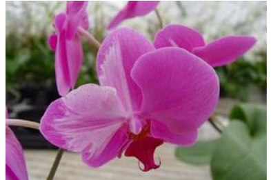
Odont. ringvirus bij Phalaenopsis

Wat doe je met een besmette plant? Weggooien is eigenlijk het beste advies. Planten genezen over het algemeen niet van een virus. Ze kunnen wel de symptomen overkomen en er weer gezond uit gaan zien, maar ook dan blijft het virus. Uit een test van een complete collectie van 365 ogenschijnlijk gezonde planten bleek toch bijna 7% besmet te zijn met een of meer virussen! ( http://bit.ly/aeovirustest ).