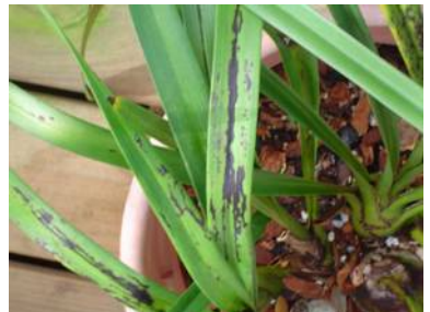
Mozaïekvirus in Cymbidium

We herkennen een virusinfectie vaak aan vreemde vlekkenpatronen op de bladeren of vlammege kleurafwijkingen in de bloemen. Soms is vrij duidelijk dat het om virus gaat, maar vaak lijkt de schade ook op die van mijten, schimmels (op de bladeren) en thrips (op de bloemen).