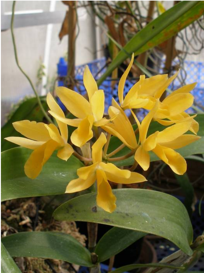
Guarianthe aurantiaca (var. flava)