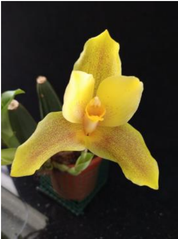
Angulocaste clowesii x macrophyllum (Peter Stomppf)

Nu er geen kringavonden zijn, missen we ook de mogelijkheid om onze planten te showen. In de WhatsApp-groep gaat dat gelukkig gewoon door. Er was zelfs even een heuse plant van de maand/week verkiezing. Omdat lang niet alle leden in de groep zitten, heb ik op deze twee pagina's voor u een kleine selectie van foto's opgenomen. Met verondersteld verlof dat een foto gedeeld in de WhatsApp van de kring ook gedeeld mag worden in dit kringblad. De namen staan er in elk geval keurig bij.