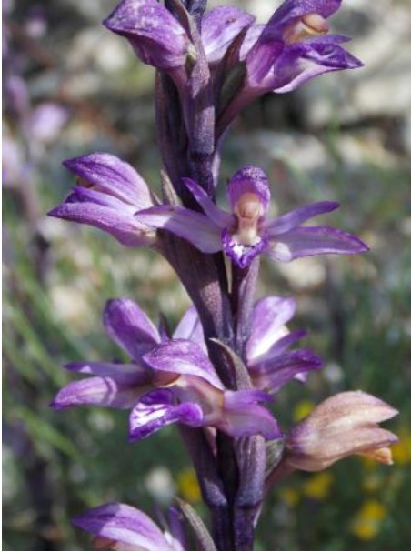
Limodorum abortivum - Paarse aspergeorchis