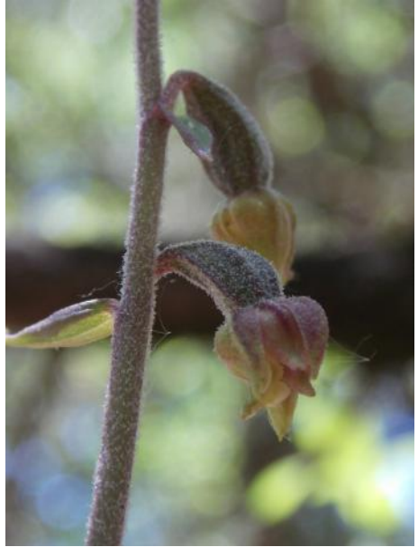
Epipactis microphylla - Kleinbladige wespenorchis