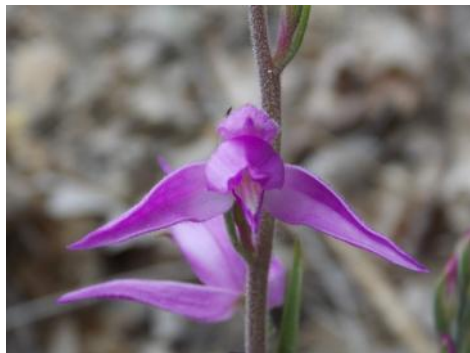
Cephalanthera rubra - Rood bosvogeltje