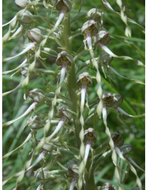
Himantoglossum hircinum - Bokkenorchis

langs de rivier naar de camping groeiden nog allerlei mooie bloemen en planten. Terwijl ik een vuurrode lelie stond te fotograferen kwam er een eigenaardig geurtje voorbij. Waar stond ik zo ongeveer bovenop? Een bokkenorchis in volle bloei!