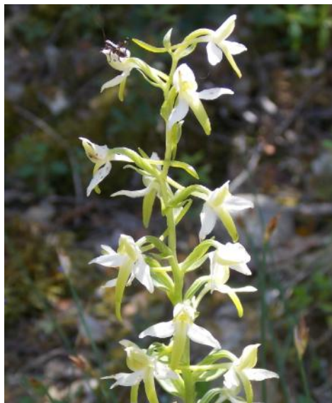
Platanthera bifolia - Welriekende Nachtorchis