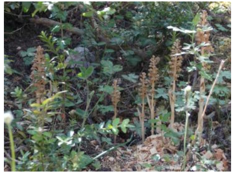
Neottia nidus-avis - Vogelnestje

Ik had van te voren uitgezocht wat in deze streek zoal zou moeten voorkomen en een van de plantjes waarvan ik hoopte dat ze zou tegenkomen was de koraalwortel. Ik had gelezen dat ze zouden groeien in dennen- en beukenbossen. In de Gorge du Verdon waren er vindplekken, maar niet aan de kant waar ik liep. Dagen heb ik naar de grond getuurd in elk bos waar ik doorliep. Ik zag van alles: keverorchis, rond wintergroen, kleinbladige wespenorchis (en die is echt klein!), vogelnestjes en nog veel meer.