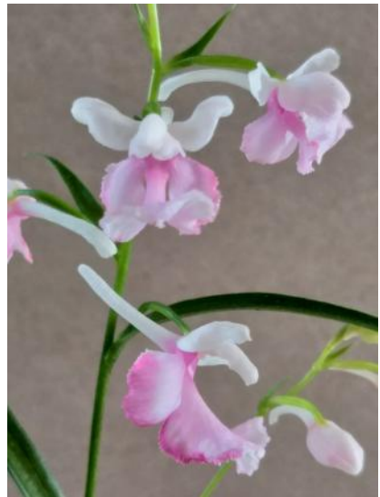
Ponerorchis graminifolia (Jo van Hoof)