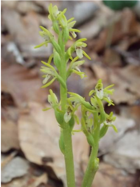
Corallorhiza trifida - Koraalwortel

de stengel en de bloem, maar dat is veel te weinig voor effectieve fotosynthese. Bladeren heeft de plant niet. Fotosynthese is sowieso een probleem omdat de plant op heel donkere plekken groeit. Het bloemetje is klein, ongeveer 7mm groot en vanwege het geringe licht lastig te fotograferen.