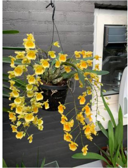
Dendrobium lindleyi (Mike Heesakkers)