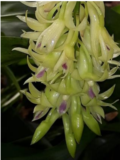
Dendrobium amethystoglossum (Jos Janssen)