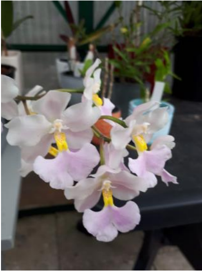
Cuitlauzina pendula (Jan Braks)