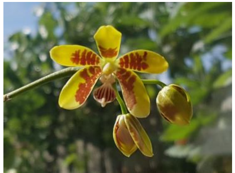
Phalaenopsis fuscata (Nathalia van Doormalen)