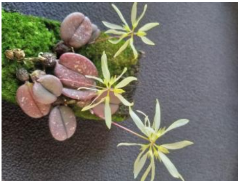
Bulbophyllum purpurascens (Jo van Hoof)