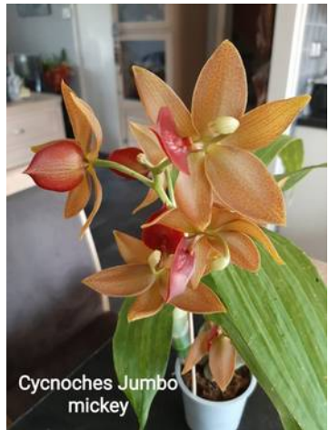
Cynoches Jumbo Mickey Cynodes Jumbo Mickey Antoon van der Veer