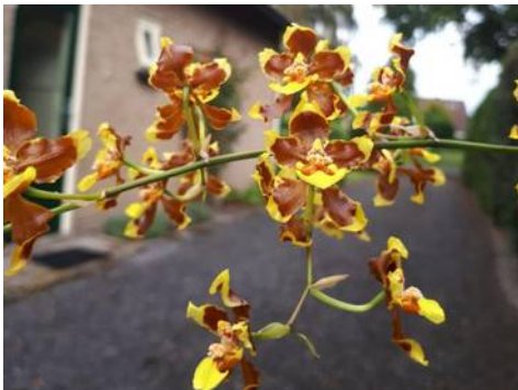
Oncidium planilabre Jan Braks