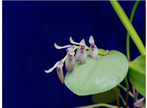
Pleurothallis Ruud Nabibaks