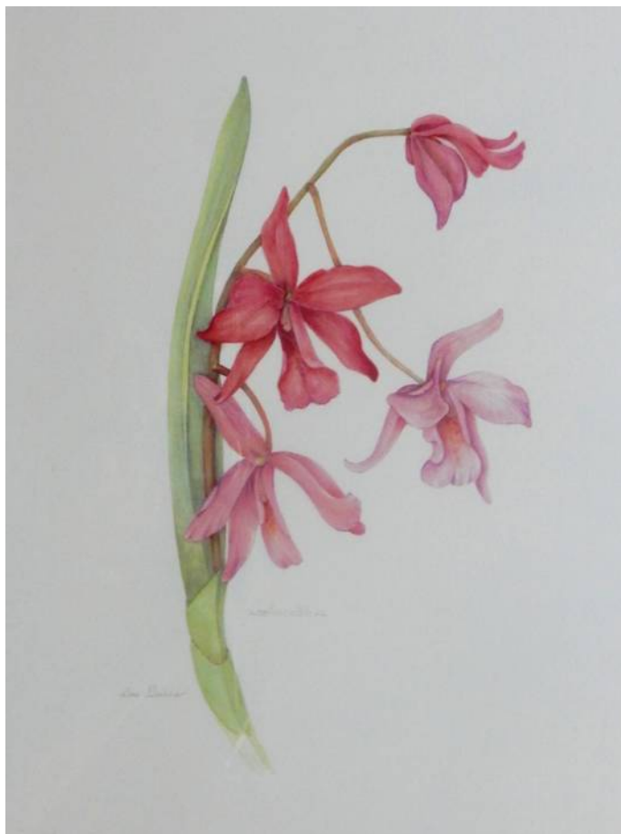
Laeliocattleya hybride botanische prent getekend door Lies Bakker aangeboden op 14 september 2020 aan Erelid Koos de Wit