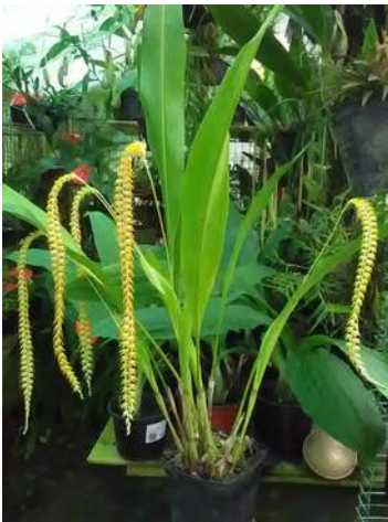
Dendrochilum magnum? Thijs Coenen