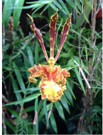
Psychopsis Mariposa Arno Janssen