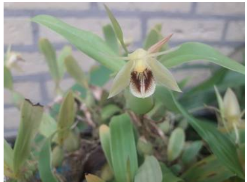
Coelogyne fimbriata Jos Laaper