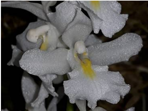
Rodrigueza venusta Jos Janssen