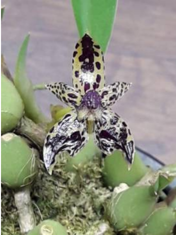
Bulbophyllum ecornutum Mike Heesakkers

In oktober werden er in onze App-groep 126 foto's gedeeld. Deze maand staat de teller al op 65 en er komen dagelijks weer foto's bij. Op deze pagina's vind je weer een kleine selectie van de foto's. Met verondersteld verlof dat een foto gedeeld in de WhatsApp van de kring ook gedeeld mag worden in dit kringblad.