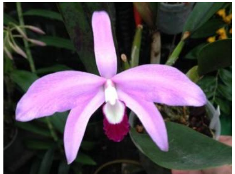
Cattleya perrinii (syn. Laelia perrinii ) Arno Janssen