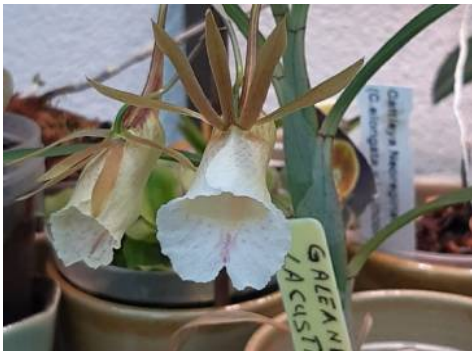
Galeandra lacustris Wim Crins