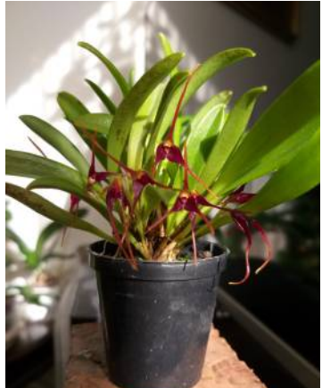
Masdevallia herradurae Jo van Hoof