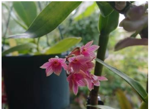
Dendrobium x usitae 'Red Coral' Renata van Eck