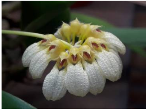
Bulbophyllum auratum var. alba Mike Heesakkers