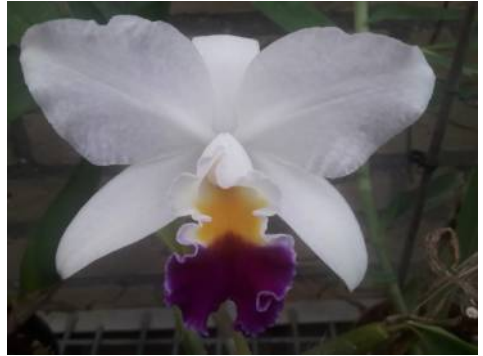
(Laelio?) Cattleya hybride Jos Laaper