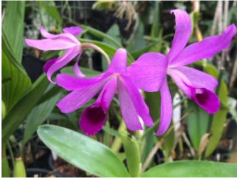
Cattleya bowringiana Thijs Coenen