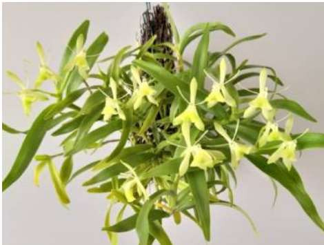
Epidendrum difforme Jo van Hoof