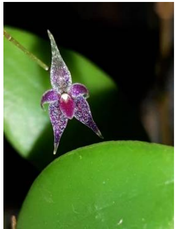
Lepanthopsis astrophora Jos Janssen