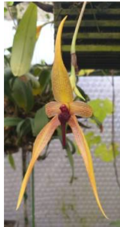
Bulbophyllum Wilbur Chang Henk de Wit