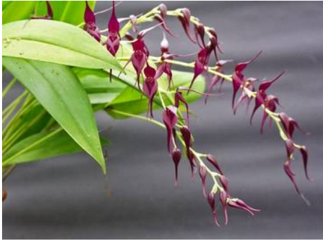
Pleurothallis phalangifera Ruud Nabibaks