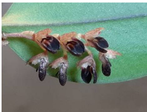
Trichosalpinx memor Antoon van der Veer