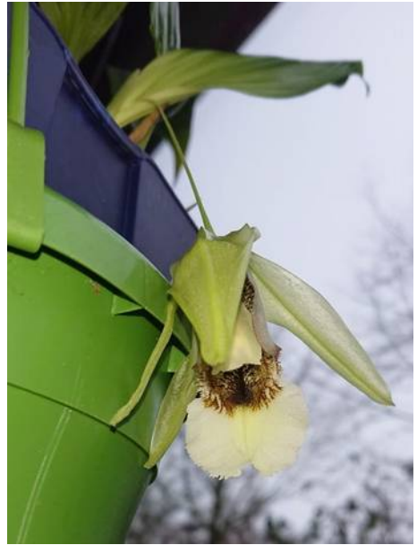
Coelogyne speciosa Renata Vilcinskaite