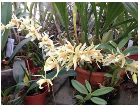
Coelogyne huettneriana Arno Jansen