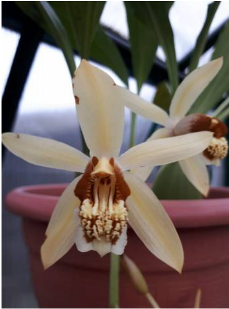
Coelogyne tomentosa Jan Braks