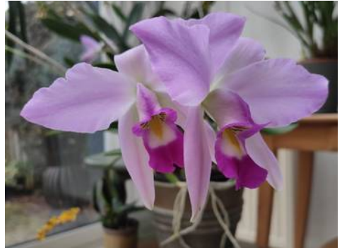
Laelia anceps Wim Crins