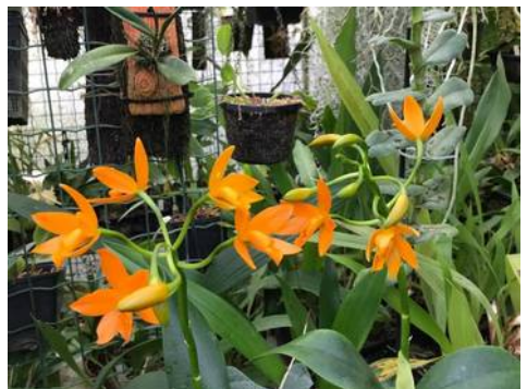
Guarianthe aurantiaca Thijs Coenen