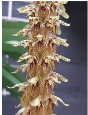
Bulbophyllum rigidum Mike Heesakkers