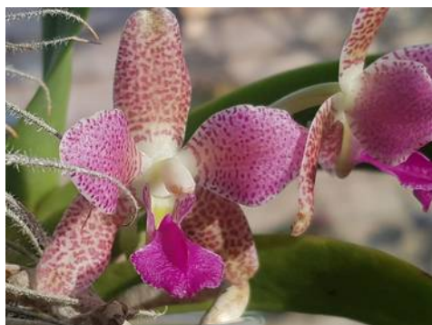
Phalaenopsis japonica x hygrochila Nathalia van Doormalen

In december werden er in onze App-groep 135 foto's gedeeld. Op de volgende pagina's vind je weer een hele kleine selectie van de foto's. Met verondersteld verlof dat een foto gedeeld in de WhatsApp van de kring ook gedeeld mag worden in dit kringblad.