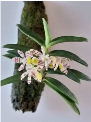
Trichoglottis pusilla jo van Hoof