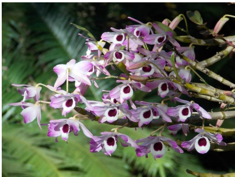
Dendrobium nobile bij Centro do Arte Inhotim, Brumadinho MG, Brazilië

Tel: 0031(0)492 59 22 71 E-mail: info@botorch.com www.botorch.nl